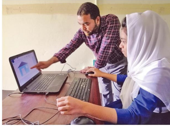
বাংলাদেশের সুবিধা বঞ্চিত ছাত্র-ছাত্রীদের তথা-প্রযুক্তি শিক্ষায় সহায়তা দিচ্ছের কম্পিউটার লিটারেসি প্রোগ্রামের এক শিক্ষক

বাংলাদেশের সুবিধা বঞ্চিত ছাত্র-ছাত্রীদের সহায়তায় বাংলাদেশি মার্কিনদের উদ্যোগে গঠিত প্রতিষ্ঠান কম্পিউটার লিটারেসি প্রোগ্রামের (সিএলপি) বার্ষিক সভা ডাচুয়াল প্লাটফর্মে ৩ অক্টোবর অনুষ্ঠিত হয়েছে। অনুষ্ঠানের উদ্দেশ্য কর্মসূচি সম্বন্ধে সচেতনতা গড়ে তোলার পাশাপাশি তহবিল সংগ্রহ করা। ২০০৪ সাল থেকে তথ্যপ্রযুক্তি শিক্ষায় সহায়তা এই প্রতিষ্ঠান কাজ করে আসছে।